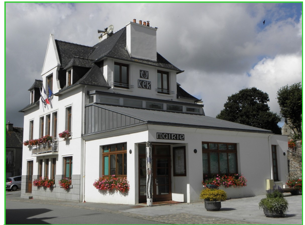
La Mairie de Spézet

La famille n'a a priori plus de lien avec Spézet et les derniers actes indiquent que la famille était partie à Angers.