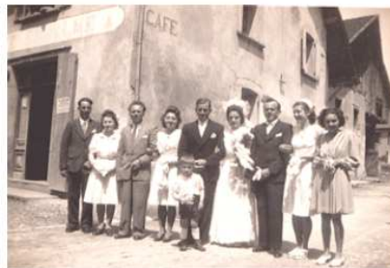
un mariage devant le café Enselme