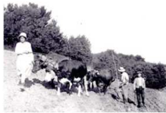
dur pour les femmes aussi

En 3 actes et 27 scènes très précisément, un gros travail des metteurs en scène et des acteurs qu'il faut souligner, différents personnages et des moments forts de la vie du village des années 1930-1970 ont été évoqués.