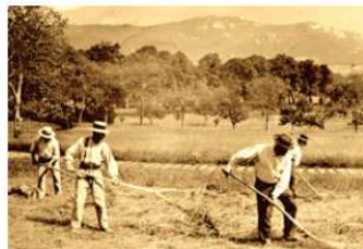
le travail et l'entraide qui soudaient les villages