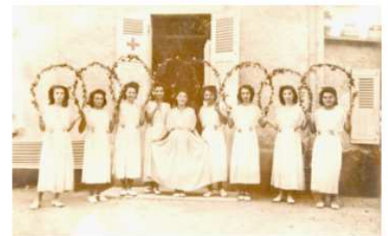
fête en 1946 pour le retour des prisonniers