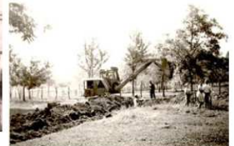
dans les années 1960 l'eau arrive à La Rossetière