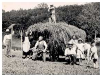
aux travaux des champs tout le monde y participait parfois