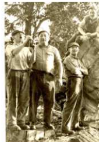
des figures de St Aupre