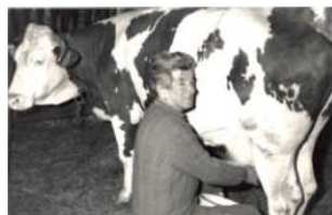
traite à la main dans les années 1970