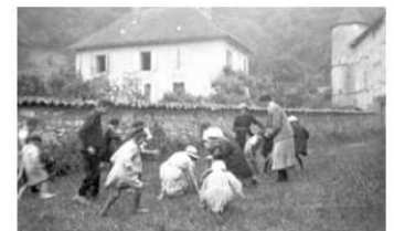
les enfants d'autrefois