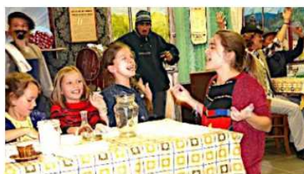
Le tilleul m'a dit c'était la fête pour les enfants, mais le tilleul ne m'a pas encore tout dit...

Les durs travaux des champs donnaient soif et les hommes, principalement, aimaient se retrouver dans ces bistrots où ils pouvaient parler de leurs préoccupations quotidiennes... même le dimanche quand femmes et enfants allaient à la messe comme évoqué dans la pièce.