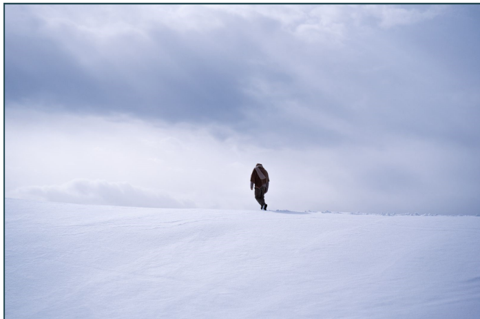
La pochette du dernier single « Maintenance »

Mon tout premier clip "Maintenance" est disponible depuis le 7 mars.