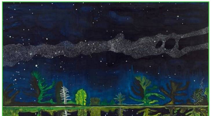
Peter Doig, "Milky Way", 1989-90 - © Adagp, Paris 2018